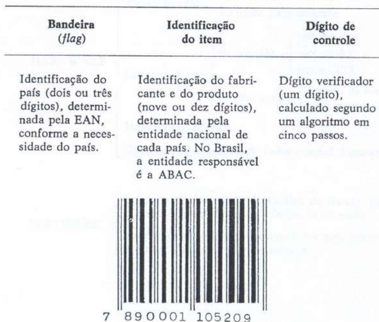
Figura 1 – Estrutura do Código EAN

versão EAN-8 para embalagens pequenas (Silva, 1989). A Figura 1 exemplifica a estrutura do código EAN adotado no Brasil.